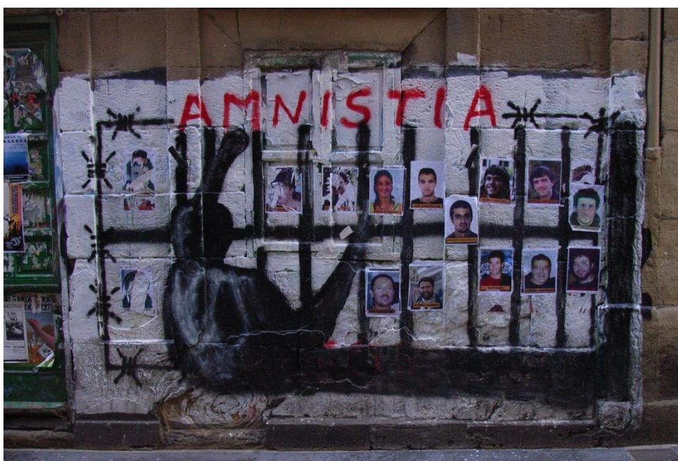
Amnestie für die Gefangenen: hier ein Graffiti in San Sebastian

keine Tageszeitung gesehen, in der nicht mindestens ein Beitrag zur Gefangenenfrage auftauchte. Tagtäglich wird von langjährigen Gefangenen oder von Neuverhaftungen berichtet. Über die Zustände in den Gefängnissen und die Rechtslage wird debattiert und gestritten, und es besteht seit geraumer Zeit die Forderung nach humaneren Haftbedingungen und einer Verlagerung der Gefangenen in das Heimatgebiet. Die spanischen Justizbehörden weigern sich jedoch, Häftlinge an lokale Behörden zu überweisen. In Cafés und Kneipen, an Hauswänden in San Sebastian und an den schwarzen Brettern der Universität Deusto in Bilbao waren Fotos von Gefangenen mit der Forderung nach Amnestie zu sehen.