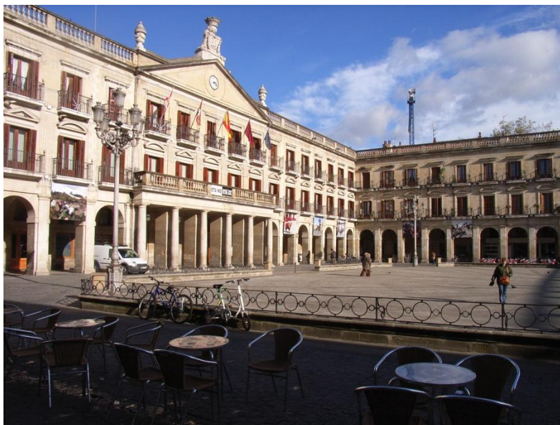
Rathausplatz im Herzen Vitorias

provinziell anmutete. Zwar wusste ich, dass baskische Städte über ihre Grenzen hinaus wenig bekannt sind, doch verwunderte mich diese Tatsache im Anbetracht der Schönheit dieser Städte dennoch. Vor allem die Hauptstadt des Baskenlandes, Vitoria, kein typisches Reiseziel und kaum international bekannt, ist eine beeindruckende Stadt mit fast vollständig erhaltendem Stadtkern und einer pulsierenden Kulturlandschaft.