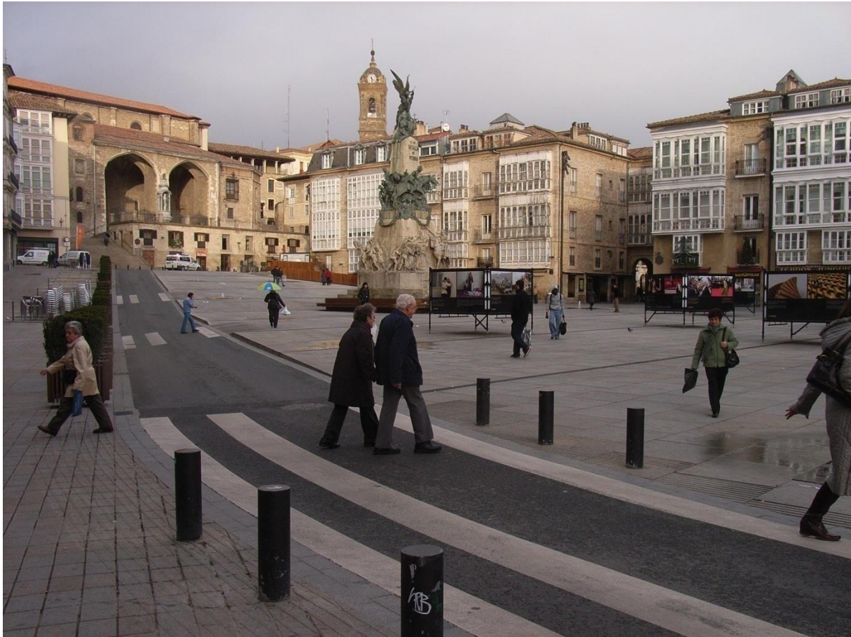
Vitoria, Plaza de la Virgen Blanca

Beobachtungen abseits der medialen Berichterstattung