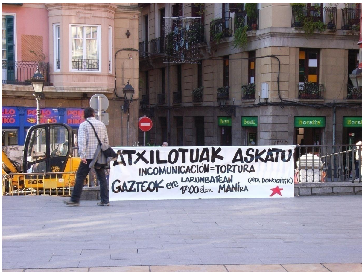
Ankündigung einer Demonstration, Bilbao: viele Friedensorganisationen und Gruppierungen fordern Transparenz und eine offene Informationspolitik im Zusammenhang mit Festnahmen von ETA-Verdächtigen

Terrorismo y de la Violencia Política oder Lokarri verfolgen ähnliche Ziele mit leicht anderen Strategien und Ausrichtungen. Lokarri beispielsweise versucht, durch einen Dialog mit der ETA und ETA-nahen Organisationen zu einer friedlichen Übereinkunft durch Dialog zu gelangen. Gesto por la Paz setzt auf Repetition. Das Mandat lautet, immer wieder die Gewalt anzuprangern, die Willkür zu verurteilen. Die Organisation hat tausende ideelle Mitglieder, die ihre Ziele und Mittel unterstützen.