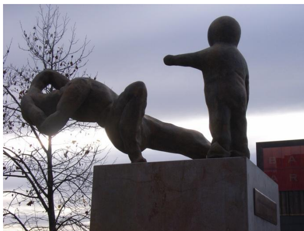
Ein Denkmal für die Opfer des Terrorismus, Pamplona: „Homenaje a las víctimas del terrorismo“. Gegen willkürlichen Terror ist die Zivilbevölkerung machtlos.