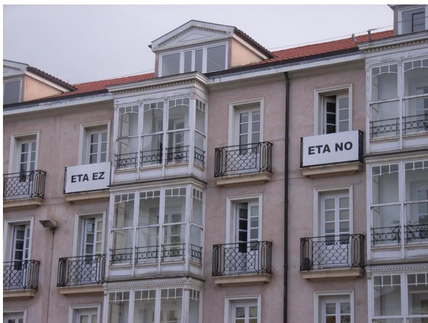
ETA EZ, ETA NO: mit einfachen Worten auf baskisch und spanisch gegen den Terror

Im Konflikt um die Autonomie der baskischen Regionen geht es im Kern um die Bewahrung des kulturellen Ausdrucks und der Anerkennung der besonderen Rechtslage sowie einer wirtschaftlichen Unabhängigkeit von der Zentralregierung. Eingriffe der Zentralregierung werden als unrecht und bevormundend empfunden. Terroristische Maßnahmen sind die Gegenreaktionen auf diese Politik, eine Erinnerung daran, dass Autonomie gewahrt werden muss. In Hinblick auf die europäische Gemeinschaft sind mehrere Aspekte zentral: Zunächst muss der Konflikt auch europaweit verfolgt und differenziert betrachtet werden. Um die Stabilität der Region langfristig zu gewährleisten, sollte die baskische Gemeinde eine direkte Repräsentation in der EU zustehen.