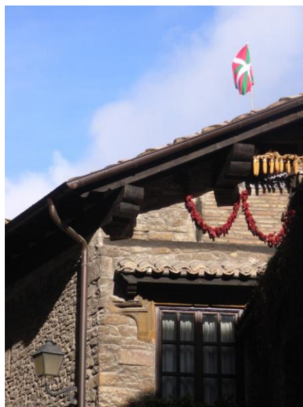
Typisches Giebeldach im Baskenland: Hier mit Flagge in Pamplona

Im Stadtbild von Pamplona sind die Spuren der Franco-Ära besonders auffällig. Francistische Häuserblocks und riesige Wohnanlagen, die nun teilweise als Ausstellungshallen benutzt werden, grenzen unmittelbar an den historischen Stadtkern, der noch in seiner Form einer ehemaligen Festungsstadt erhalten ist. Sie geben dem kulturell sonst so lebendigen Pamplona einen trostlosen Beigeschmack. Die Tradition der Stierkämpfe und vor allem der Stierläufe während der jährlichen Feierlichkeiten der Sanfermines ist das kulturelle Aushängeschild der Stadt. Zu den encierros kommen jedes Jahr mehrere Tausend Touristen in die Stadt, um die Stierläufe zu verfolgen. Zudem ist Pamplona auf dem Jakobsweg gelegen, was ihr eine zusätzliche Besucherzahl verschafft. Trotzdem wirkten auch die großen Wohnsiedlungen während meines Besuchs verschlafen und ruhig. Ich lernte zwei Studenten aus Navarra kennen, die es sehr überraschte, dass ich Pamplona außerhalb der Saison besuchte.