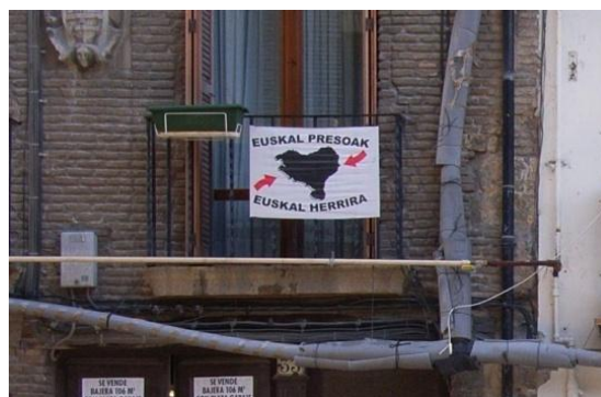
Typisches Straßenbild im spanischen Baskenland: Banner an Balkonen und Hauswänden

Auch die Analyse des politischen Konflikts bezieht sich auf die Spannungsverhältnisse zwischen der Regierung in Madrid und den spanischen baskischen Provinzen sowie auf interne Spannungen zwischen Gruppen innerhalb der baskischen Gesellschaft. Die Beziehungen zu Frankreich und zur französischen Justiz, die durch das gemeinsame Vorgehen gegen ETA- Mitglieder und Verdächtige geprägt werden, sind im EU-weiten Kontext jedoch ebenso relevant.